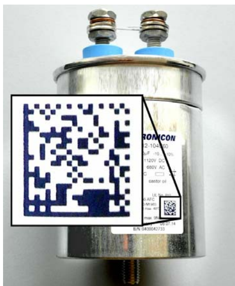
Beispiel einer Markierung auf einem E62-Kondensator

Vertretung Schweiz ADC Advanced Datacommunication Consulting AG Renggerstrasse 3, 8038 Zürich Tel. +41 (0)44 485 40 50 Fax +41 (0)44 485 40 59 E-Mail kondensatoren@adc-ag.ch www.adc-ag.ch